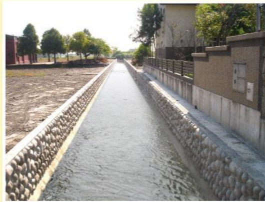
▲月眉排水十中排改善後

另，羅東鎮新群里約70公頃地勢較低農田，常年遭受淹水，本會就「易淹水地區水患治理計畫」提報，積極爭取中央補助經費打那岸十中排等6線改善工程改善水路約2,764公尺，總工程費達新台幣30,366,000元，除可減少人民生命及財產損失外，並改善居家衛生及生活環境，使其不利條件降至最低，以增加土地生產利用價值，並有助於區域平衡發展，提高生活品質。