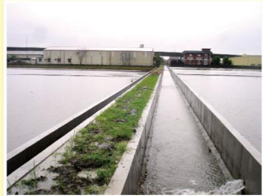
▲月眉排水截水溝北富9-2小排改善後