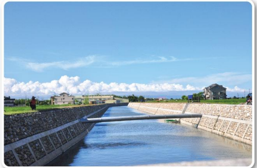
▲林和源排水南富二中排-施工後