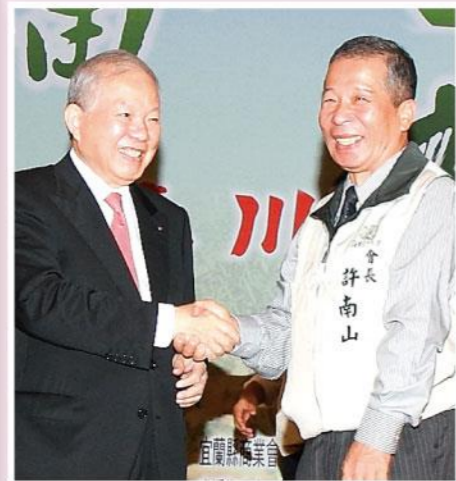
▲何董事長與許會長合照

本會為擴大會員服務並倡導有機農業，於102年11月9日（星期六）上午09:00-12:00假宜蘭運動公園體育館，辦理「幸福農村·有機田園」系列（三）講座，並邀請永豐金控股份有限公司—何壽川董事長主講「幸福人生，有機田園」，參加者非常踴躍，共吸引1千5百餘民眾前來聆聽，結束後並開放現場提問及媒體記者採訪…。