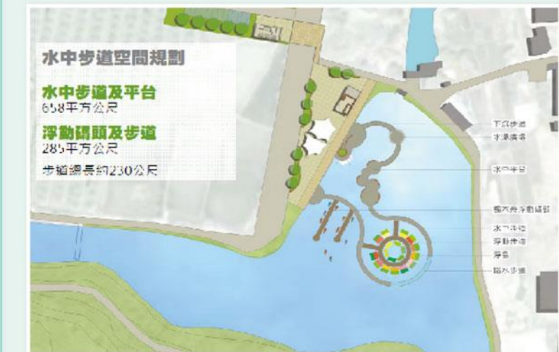
▲宜蘭縣政府委託大凡工程顧問有限公司規劃之示意圖

本會所有大湖湖域，位處宜蘭縣員山鄉，面積約為10.6公頃，原為出租使用，因租約已屆期，刻辦理訴請收回中。目前大湖仍存有未受干擾之原始生態風貌，且宜蘭縣政府亦正委託規劃如何施行低密度(如水中步道)之遊憩使用，並與現有廣場及碼頭結合水胡同概念，提供遊客感受大湖之水上、水面及水中央之不同視覺觀賞角度。