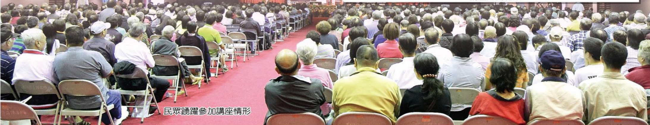
民眾踴躍參加講座情形