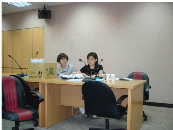
照片六、查證人員查核經費支出及憑證資料。