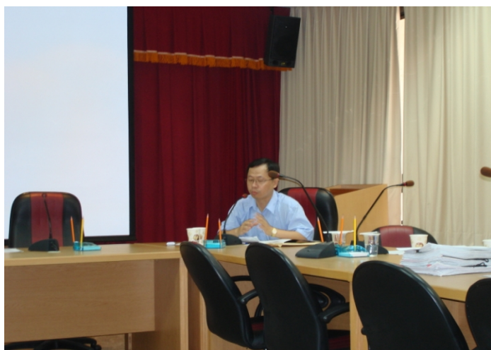
照片二、查證人員詢問計畫執行情形。