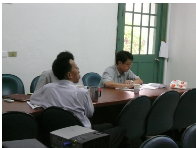
照片二、查證人員詢問計畫執行情形。