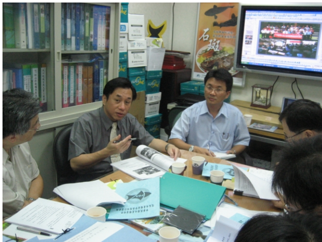
照片三、查證小組人員與查證單位（養殖協會）進行討論。