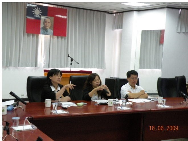
照片四、查證人員詢問計畫執行情形。