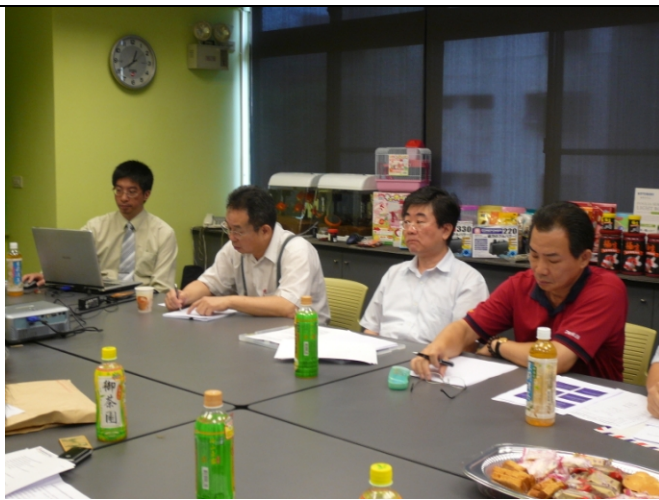
照片三、養殖魚種市場競爭力之查證情形。