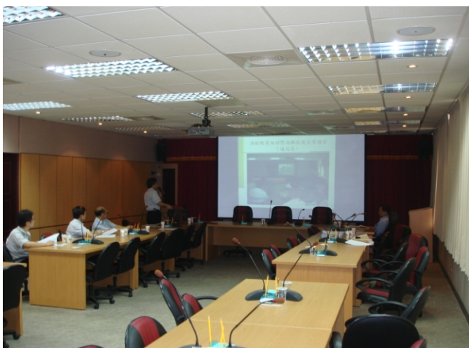
照片一、台灣省漁會報告計畫執行情形。