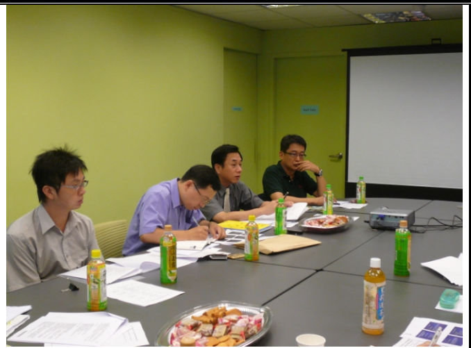
照片二、養殖魚種市場競爭力之查證情形。