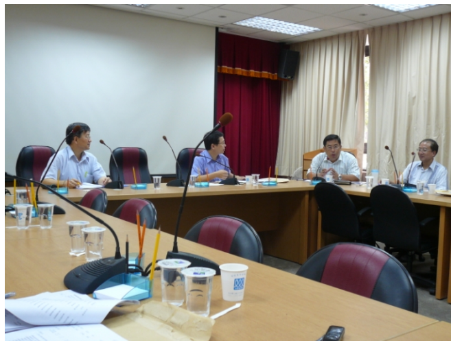
照片二、漁業推廣教育計畫查證情形。