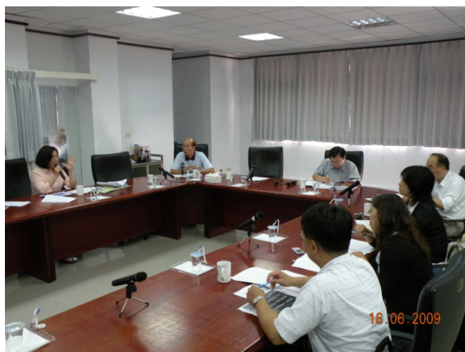
照片二、澎湖縣政府農漁局報告計畫執行情形。