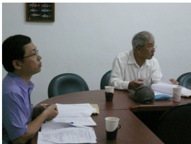
照片三、查證人員詢問計畫執行情形。