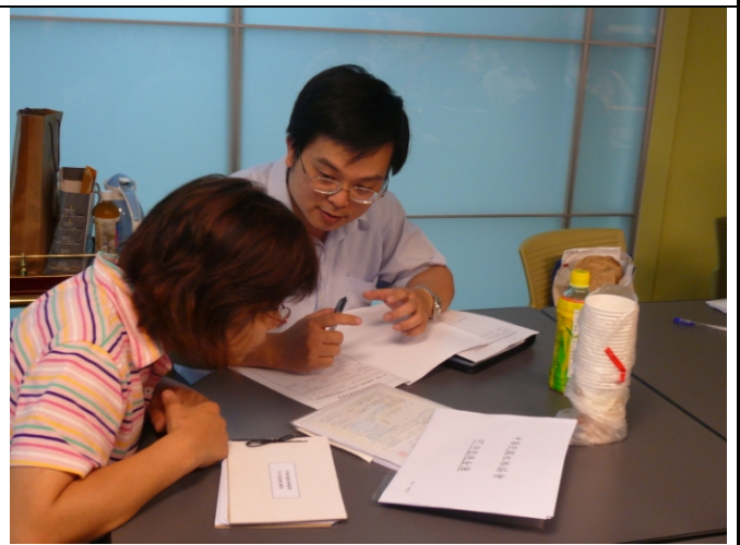
照片四、養殖魚種市場競爭力之查證情形。