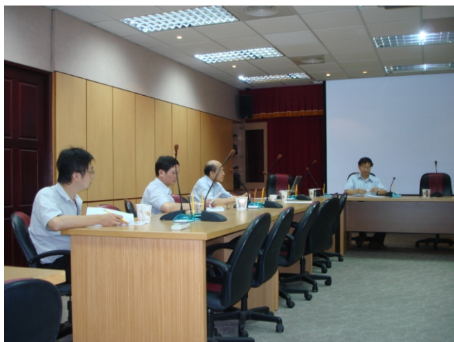
照片四、查證人員詢問計畫執行情形。