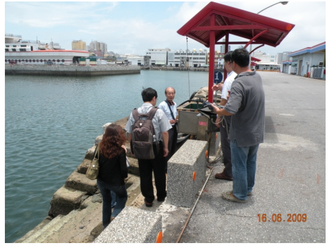
照片八、查證人員瞭解固定式航程讀取器情形。