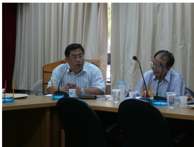
照片四、漁業推廣教育計畫查證情形。