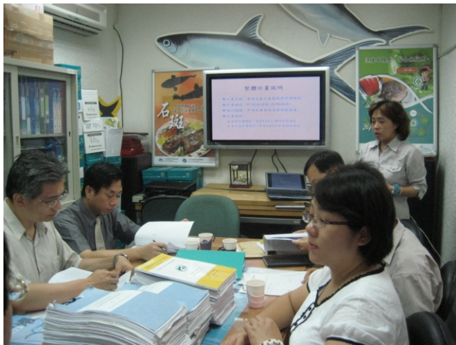
照片一、由計畫主管單位向查證小組人員進行計畫內容簡報。