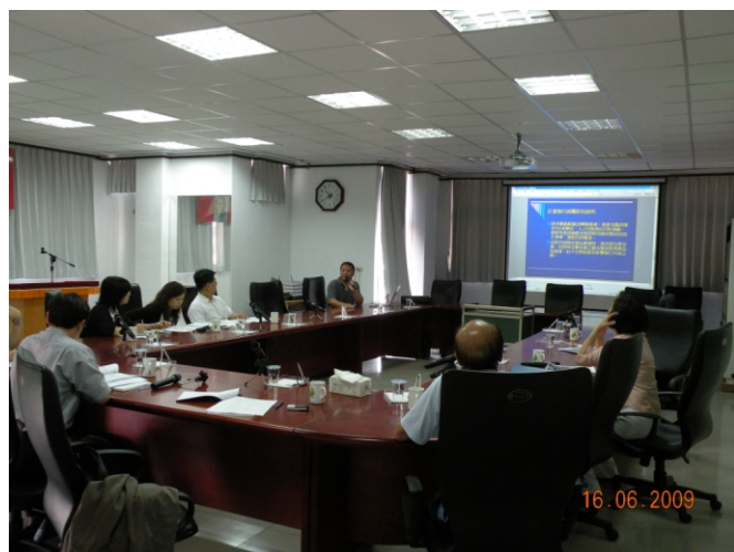
照片一、澎湖區漁會報告計畫執行情形。