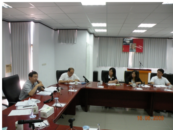
照片三、查證人員詢問計畫執行情形。