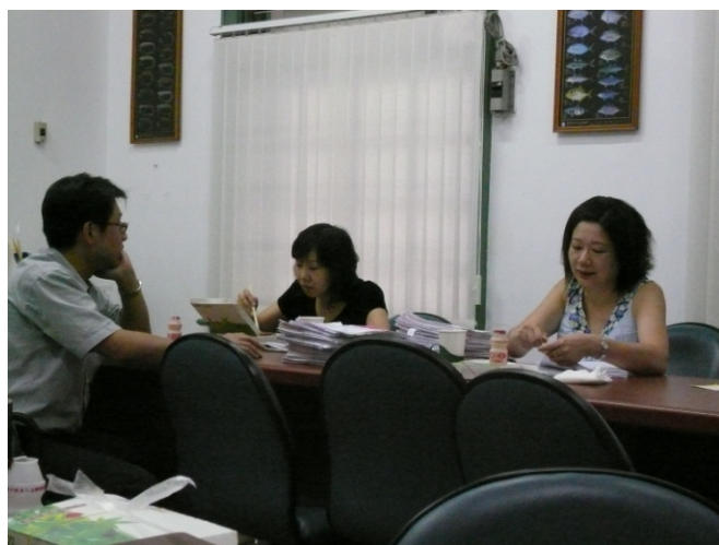
照片四、查證人員詢問計畫執行情形。