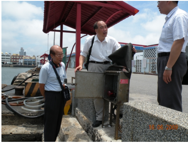
照片七、查證人員瞭解固定式航程讀取器。