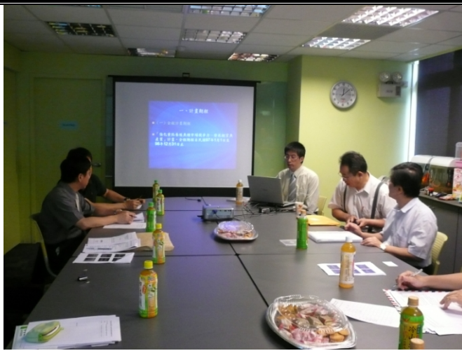
照片一、養殖魚種市場競爭力之查證情形。