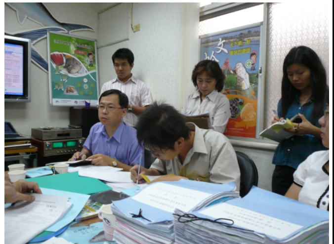
照片四、查證小組人員與查證單位（養殖協會）進行討論。