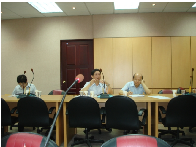
照片三、查證人員詢問計畫執行情形。