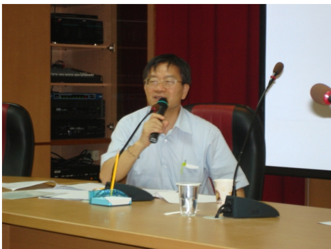
照片五、執行單位回復查證人員詢問事宜。