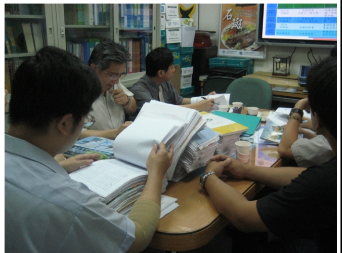
照片二、查證小組人員進行計畫內容簡報。