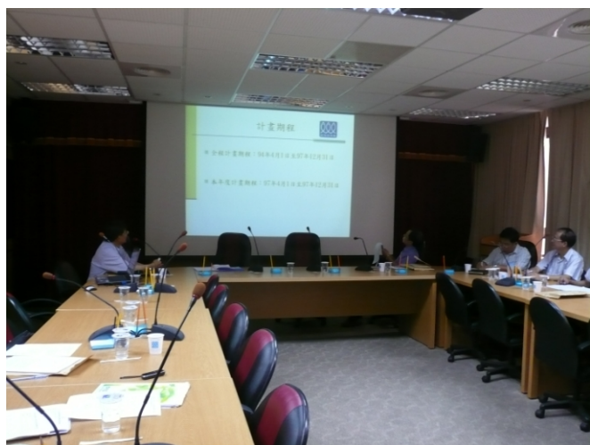
照片三、漁業推廣教育計畫查證情形。