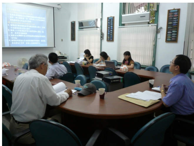
照片一、查證人員詢問計畫執行情形。