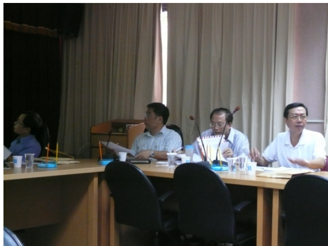
照片一、漁業推廣教育計畫查證情形。