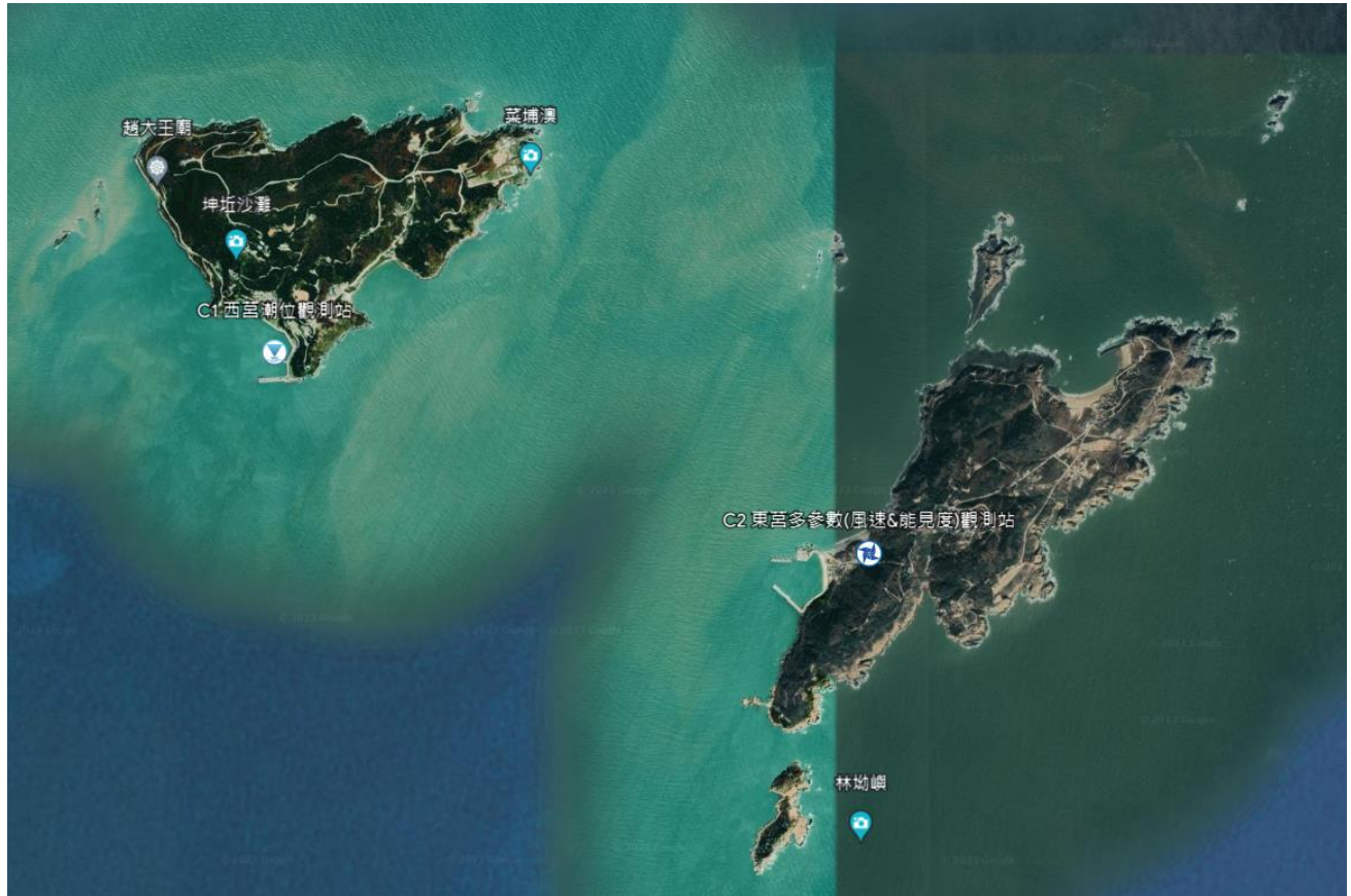
圖 2 莒光鄉海氣象儀器設備位置示意圖